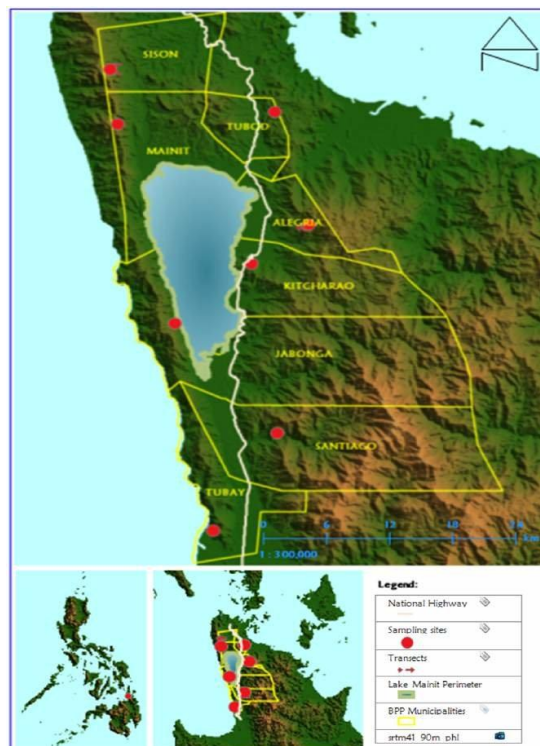
Figur 2.a (Mapa ng Mainit)

Isang gabing kabilugan ng buwan, nagpulong ang mga diwata at humiling na mailipat ang kanilang tinitirhang kabundukan sa dati nitong kinalalagyan. Kinuha ng pinakamatanda diwata ang kanyang baston at itinatapik sa lupa ng tatlong beses. Sa isang iglap, ang kinatatayuan nilang lupa ay umalsa at lumipad pakanluran papuntang dagat. Ang nabakanteng lugar ay napuno ng tubig mula sa mga ugat ng kabundukan. At ang anyongtubig na nabuo ang sinasabing pinagmulan ng Lawa ng Mainit.