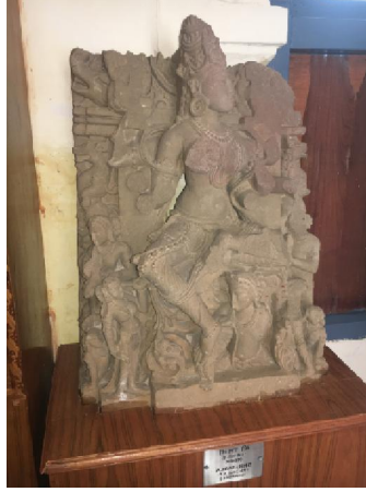
श्रीतरला (11वीं शदी ई.) शहडोल की मूर्ति धुबेला संग्रहालय छतरपुर

इनके बनवाये मंदिरों और मूर्तियों का प्रमाण अभी भी प्राप्त होता है। जो मंदिर ध्वस्त हो गये किसी, कारण वश, उनके अवशेष मूर्तियां संग्रहालयों में स्थापित है जैसे— रीवा संग्रहालय, शहडोल संग्रहालय, जबलपुर संग्रहालय, धुबेला संग्रहालय और राज्य संग्रहालय भोपाल में प्रतिष्ठित है। जिन मूर्तियों के आधार पर मैंने अपने शोध कार्य को पूरा किया उन्हीं मूर्तियों में वस्त्र और आभूषण की बारीकियों को देखकर वर्णन किया।